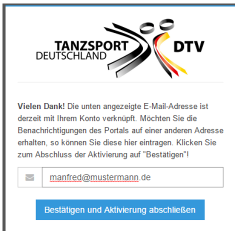
Abbildung 2 – Eingabe der E-Mail-Adresse

Für die Aktivierung der Karte benötigen Sie Ihre ID-Nummer, die auf der Karte aufgedruckt ist (unterhalb des Strichcodes, z.B. DE100010016) sowie Ihr Geburtsdatum. Haben Sie beides eingegeben, klicken Sie auf den Knopf „Jetzt aktivieren!“.